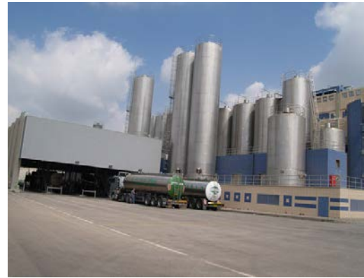
مصنع صناعة غاز الأمونيا (النشادر)