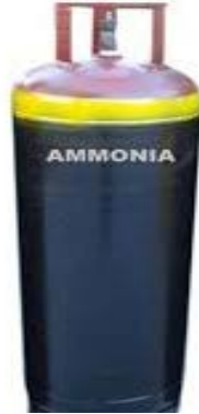
قارورة غاز النشادر