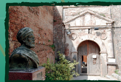
Ibn Khaldoune, Casbah de Bejaia